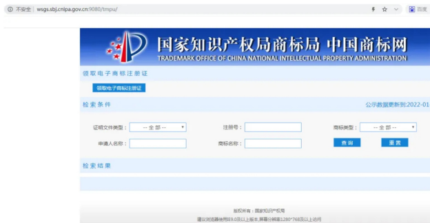
图2：商标注册证明公示系统